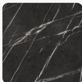
Pietra Grigia Czarna F206 ST9 Tekstura powierzchni Matowa