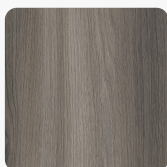
Wiąz Aurora Kamienny K364 PW Tekstura powierzchni Perfect Wood