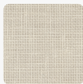
Len Beżowy F425 ST10 Tekstura powierzchni Rustykalne Pory