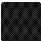
Tekstura powierzchni Grip