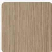
Tekstura powierzchni Fornir