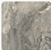
Marmur Cipollino Szary F093 ST7 Tekstura powierzchni Smoothtouch Fine Pearl