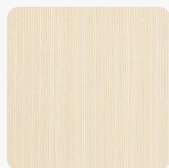
Jesion biały Tekstura powierzchni Fornir