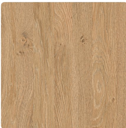
Kliknij, aby powiększyć