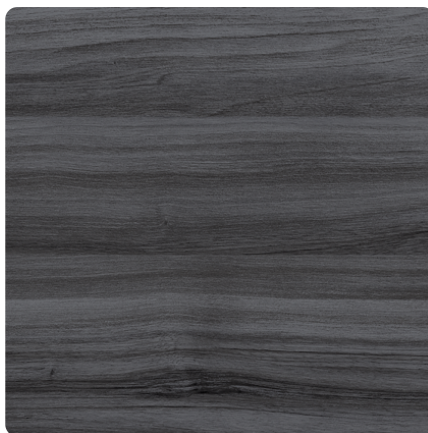
Kliknij, aby powiększyć